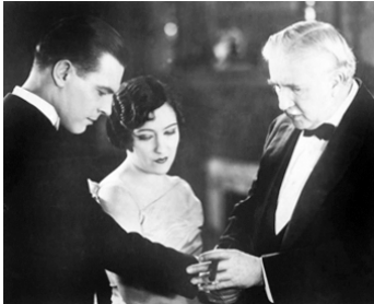
1925 L'INDOMPTABLE (The Untamed Lady) de F. Tuttle avec Lawrence Gray, Joseph Smiley