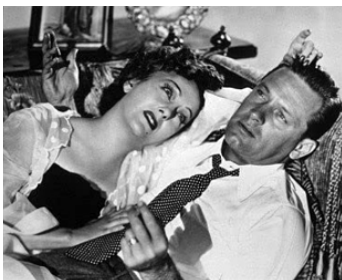
1950 BOULEVARD DU CRÉPUSCULE (Sunset Boulevard) de Billy Wilder avec William Holden