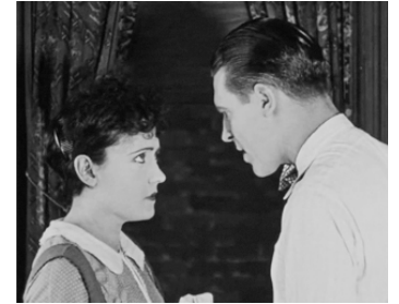
1925 VELETTE (Stage Struck) d'Allan Dwan avec Lawrence Gray