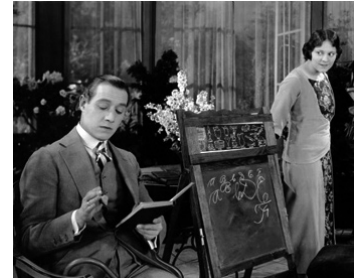
1920 L'AMOUR A-T-IL UN MAÎTRE ? (Something to think about) de C. DeMille avec Elliott Dexter