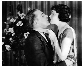
1921 LE CŒUR NOUS TROMPE (The Affairs of Anatole) de Cecil B. DeMille avec Wallace Reid