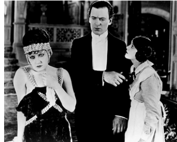
1919 L'ADMIRABLE CRICHTON (Male and Female) de C. DeMille avec Lila Lee, Thomas Meighan