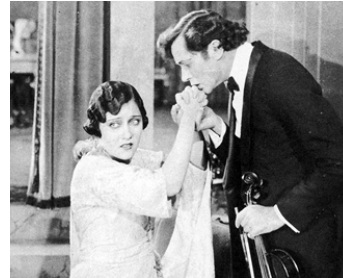
1920 L'ÉCHANGE (Why change your Wife ?) de Cecil B. DeMille avec Theodore Kosloff