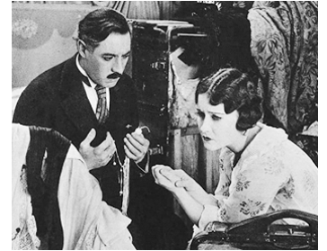
1918 APRÈS LA PLUIE, LE BEAU TEMPS (Don't change your husband) de C. DeMille avec J. Neill