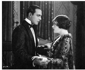
1924 SCANDALE (A Society Scandal) d'Allan Dwan avec Ricardo Cortez