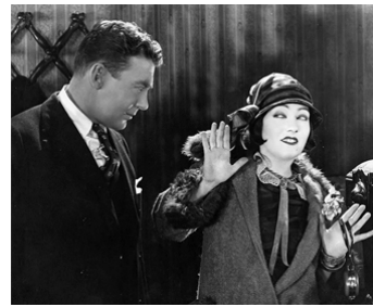
1924 TRICHEUSE (Manhandled) d'Allan Dwan avec Tom Moore