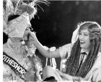
1925 LE PRIX D'UNE FOLIE (The Coast of Folly) d'Allan Dwan avec Dorothy Cumming