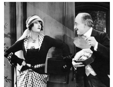
1923 ZAZA (Zaza) d'Allan Dwan avec Ferdinand Gottschalk