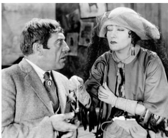
1922 LA DICTATRICE (My American Wife) de Sam Wood avec Walter Long