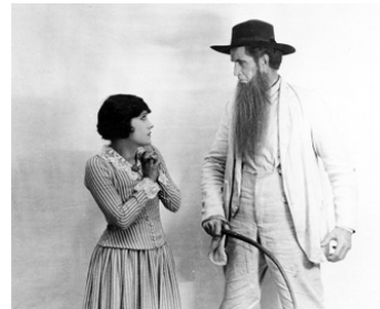
1921 UNDER THE LASH de Sam Wood avec Russell Simpson