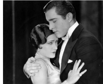
1927 SUNYA (The Love of Sunya) d'Albert Parker avec John Boles