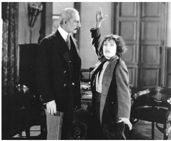
1923 LES LOUPS DE MONTMARTRE (The Humming Bird) de Sidney Olcott avec William Ricciardi