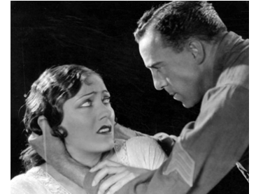
1928 FAIBLESSE HUMAINE (Sadie Thompson) de Raoul Walsh avec R. Walsh