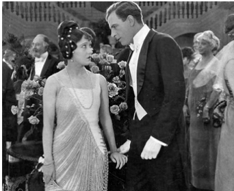
1920 L'HEURE SUPRÊME (The great Moment) de Sam Wood avec Milton Sills