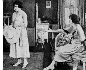
1918 YOU CAN'T BELIEVE EVERYTHING de Jack Conway avec Iris Ashton