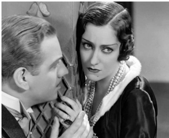
1931 CETTE NUIT OU JAMAIS (Tonight of never) de Mervyn LeRoy avec Melvyn Douglas