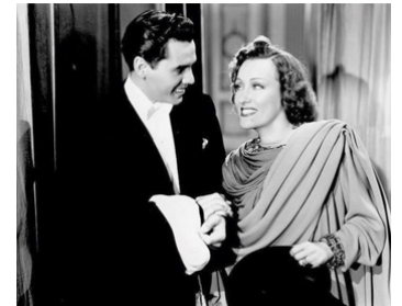
1941 PAPA SE MARIE (Father takes a wife) de Jack Hively avec Desi Arnaz