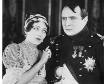
1925 MADAME SANS-GÊNE de Léonce Perret avec Émile Drain