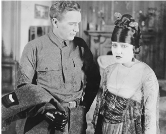
1919 POUR LE MEILLEUR ET POUR LE PIRE (For better, for worse) de C. DeMille avec Tom Forman