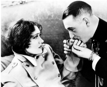
1928 LA REINE KELLY (Queen Kelly) d'Erich von Stroheim avec Walter Bryon