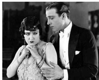
1922 LE DROIT D'AIMER (Beyond the Rocks) de Sam Wood avec Rudolph Valentino