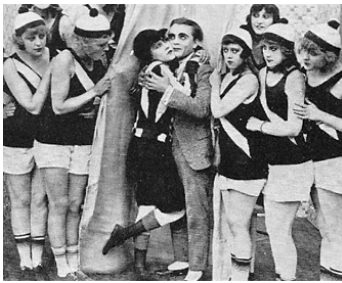
1916 A SOCIAL CLUB de Clarence G. Badger avec Bobby Vernon, the Bathing Beauties