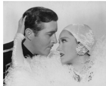
1934 MUSIQUE DANS L'AIR (Music in the Air) de Joe May avec John Boles