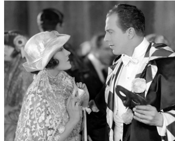
1926 MONDAINE (Fine Manners) de Richard Rosson avec Eugene O'Brien