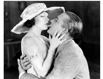
1921 FAUT-IL AVOUER ? (Don't tell everything) de Sam Wood avec Wallace Reid