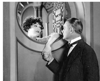
1923 LA 8 E FEMME DE BARBE-BLEUE (Bluebeard's eight wife) de Sam Wood avec Huntley Gordon