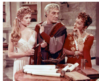
1956 LES WEEK-ENDS DE NÉRON (Mio figlio Nerone) de Steno avec B. Bardot, V. De Sica