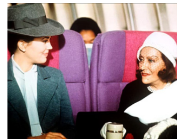
1974 747 EN PÉRIL (Airport 75) de Jack Smight avec Linda Harrison