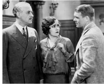
1929 L'INTRUSE (The Trespasser) d'Edmund Goulding avec Purnell Pratt, Robert Ames