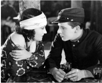
1924 LE LÉGIONNAIRE (Wages of Virtue) d'Allan Dwan avec Ben Lyon