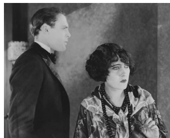
1923 LES FEMMES LIBRES (Jazzband/prodigal Daughters) de Sam Wood avec Ralph Graves