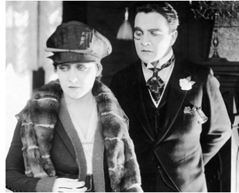
1918 SOCIÉTÉ À VENDRE (Society for sale) de Frank Borzage avec William Desmond