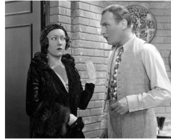
1930 QUELLE VEUVE ! (What a widow !) d'Allan Dwan avec Lew Cody