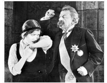
1924 LES LARMES DE LA REINE (Her Love Story) d'Allan Dwan avec George Fawcett